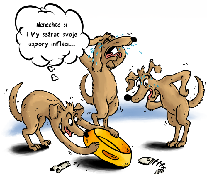
ČÁSTKA NA BĚŽNÉM ÚČTĚ, ČI DOMA 100.000,-

V prvním čtvrtletí roku 2022 se očekává meziroční inflace k 8%, možná až k 10%. Potom ekonomové předpokládají, že by inflace mohla klesat. Pro ochranu financí proti inflaci dnes existuje řada nástrojů. Ať jsou to různé typy dluhopisů, nemovitostní fondy či komodity. Rádi vám v tom poradíme.